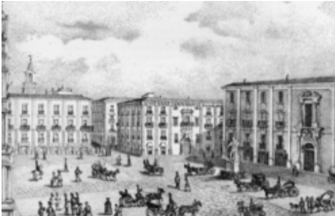
Catania, Piazza della Regia Università. Disegno di Salvatore Zurrìa.

Al di là di Catania si apre l'immensa distesa del mare. Poi a tramontana della Villa al Borgo sorge maestoso l'Etna con le sue nevi immacolate e il suo fuoco devastatore e purificatore.