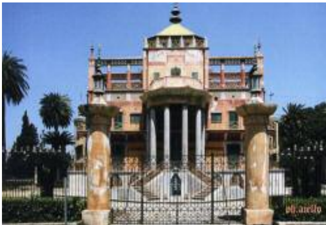
Palazzina Cinese

La facciata è preceduta da un portico centrale formato da sei colonne disposte a semicerchio, e culmina in una costruzione ottagonale con una copertura a pagoda detta Specola o Stanza dei venti. Impreziosita e abbellita durante la lunga permanenza della coppia reale in epoca napoleonica, la tenuta rimane inalterata nel corso del XIX secolo. Il parco appare oggi notevolmente cambiato: sopravvivono la Palazzina, il padiglione neoclassico di Giuseppe Patricola, i due piccoli padiglioni neogotici, la statua di Ercole (copia di quella della collezione Farnese) e quella di Diana; nulla rimane invece delle numerose fontane, dei viali di bosso, dei boschetti di mirto, della Coffee House e soprattutto delle numerose colture impiantate originariamente.