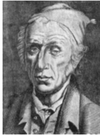
Domenico Tempio, incisione del francese D.Huot, 1814

Ricominciamo col presentarvi un poeta catanese del Settecento, Domenico Tempio, oggi sconosciuto ai più, ma che assieme a Giovanni Meli rappresenta il punto di riferimento più alto della poesia dialettale siciliana. Il Tempio è da considerare anche il maggiore poeta riformatore siciliano, la cui voce si leva contemporaneamente a quella del Parini. Egli fu ammirato e lodato dai suoi contemporanei, ma dopo la sua morte la sua opera fu quasi dimenticata, tranne alcuni componimenti di carattere licenzioso che, pubblicati alla macchia, gli diedero ingiusta fama di poeta pornografico.