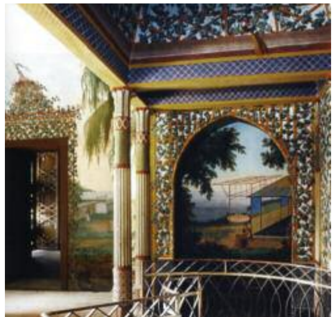
Interno della Palazzina Cinese