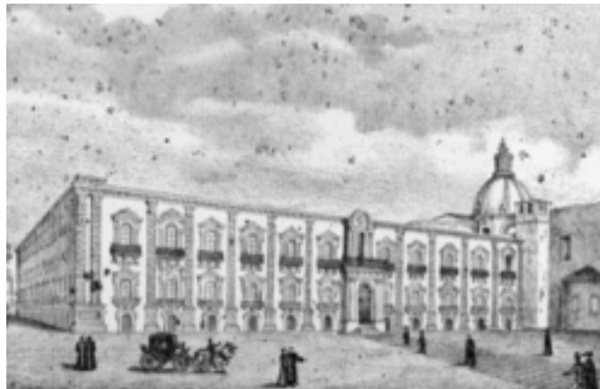
Catania, Monastero dei Benedettini (disegno di Salvatore Zurria)

E l'Arte? L'Arte se ne sta quasi in cruccio, timida e appartata, non ha l'ardire di manifestarsi, teme di recare offesa ai disegni del Vero Piacere. Ma il Bello la toglie d'impaccio, la chiama come compagna all'opera; sicché tra Arte e Piacere si accende una nobile gara.