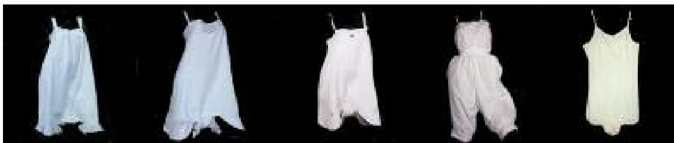
Combinazioni presenti nella Collezione Piraino

Nel 1917 furono aderenti superiormente con i calzoncini al ginocchio, increspatis e arricchiti con nastri e pizzi. Sempre nello stesso periodo ne fu confezionata una versione più ampia inferiormente, svasata a mò di sottana e trattenuta in vita da elastico. Andando avanti negli anni le combinazioni furono più corte, superiormente concepite come un top, con taglio impero e, inferiormente simili ad ampie coulottes. L'invenzione di questo capo intimo fu ritenuta estremamente pratica e rispondente alle nuove esigenze della donna che cominciava ad affac-