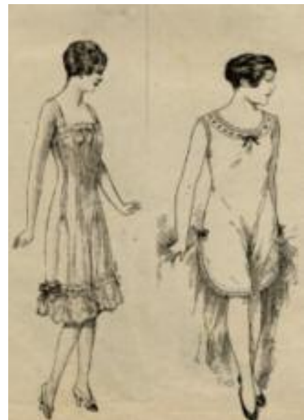
1918 - La biancheria elegante Copribusto-mutande