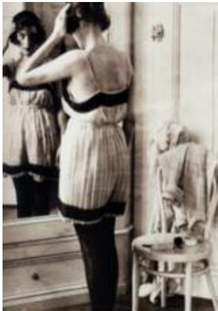
Francia 1920 Combinazione camicia-mutanda

M La combinazione è l'unione di diversi capi di biancheria.: camicia-mutanda, mutanda-sottogonna, camicia-mutanda-sottogonna. Nei primi anni del '900, nel clima che si era creato circa la semplificazione dell'abbigliamento e quindi anche della lingerie, si affermarono questi nuovi indumenti. Essi racchiusero le caratteristiche di più indumenti in uno solo. Le fogge furono varie e le sarte le realizzarono utilizzando diversi materiali: tela batista, seta, merletti, trine e tessuti elasticizzati ma sempre in tenui colori. Questi capi divennero sempre più simili alle sottovesti ma, con l'unico accorgimento di una patta abbottonata tra le gambe che li trasformava in mutande.