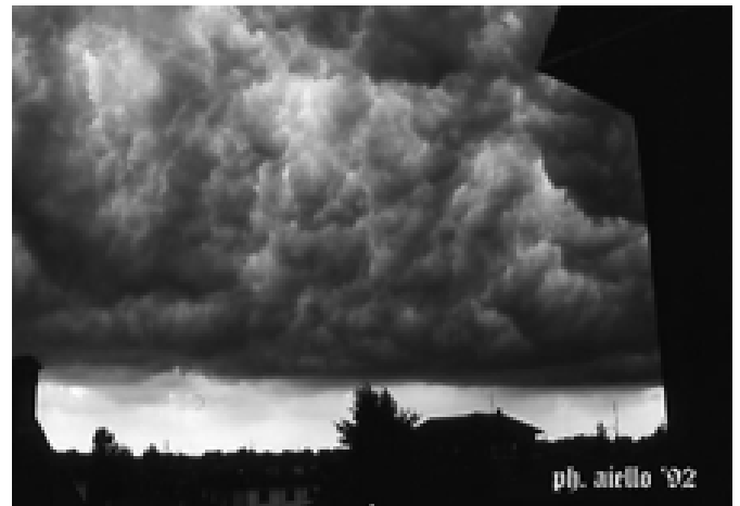
Arrivo di una tempesta.

Questo è realismo, o verismo o naturalismo, se vogliamo, ma soprattutto frammento di altissima poesia.