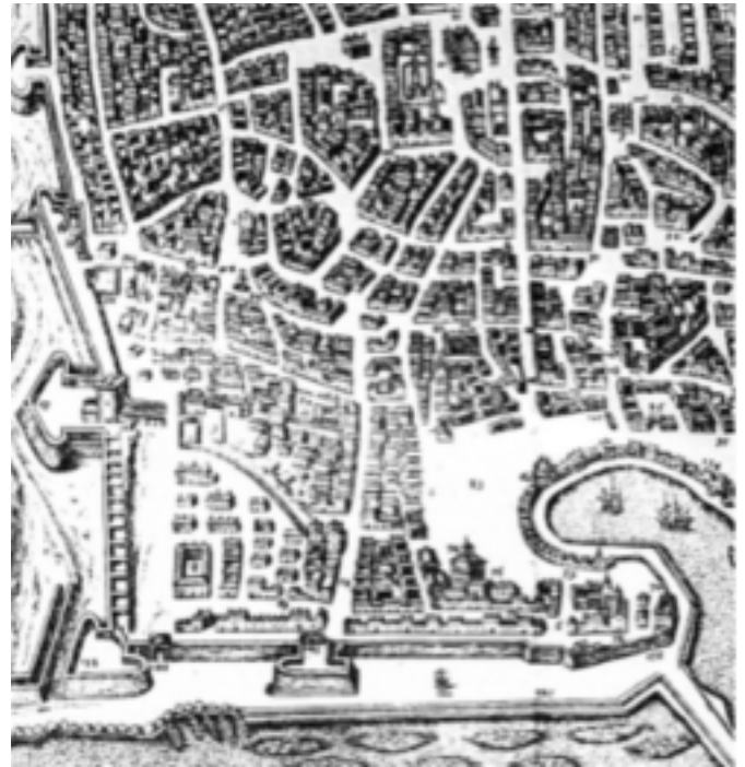
Particolare della pianta di Palermo di G. Braun e F. Hogenberg (1581)

I disegni progettuali pervenivano ai Deputati delle