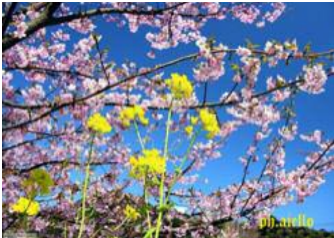
Lo splendore della primavera

Tuttu ama: un duci affettu prova ogn'omu chi l'invita ad amari, e senti in pettu nova forza e nova vita.