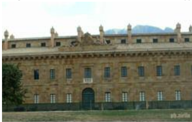
Casina di caccia di Ficuzza (Corteone)