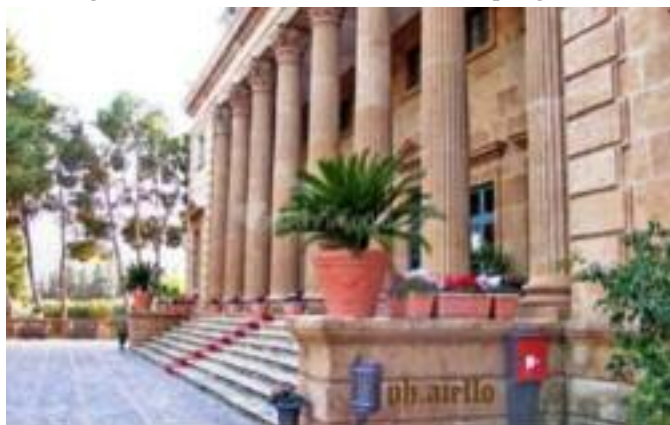
Bagheria - Villa Villarosa

Doveva forse servire per rendere più agevole uno dei suoi luoghi preferiti per la posta del cinghiale. Se il polmone verde di Ficuzza è giunto fino a noi, lo dobbiamo alla passione per la caccia di Ferdinando I. Nel 1803 egli riunì gli oltre diecimila ettari dei feudi di Ficuzza, Lupo e Cappelliciere e ne fece un gran feudo di caccia e diede contemporaneamente mandato al Marvuglia, (che già aveva elaborato un progetto, vincendo il secondo premio nel concorso clementino del 1758), di eseguire il progetto, che secondo precise fonti era stato ideato da Carlo Chenchi, per realizzare una palazzina reale. Il Marvuglia utilizzò mastodontici blocchi di pietra arenaria, merlettati e lavorati a mano nei balconi, sulle balaustre, intorno alle finestre e nei colmi del tetto. Ai lati della palazzina, capace di ospitare comitive di cacciatori, due ali di scuderie, oggi