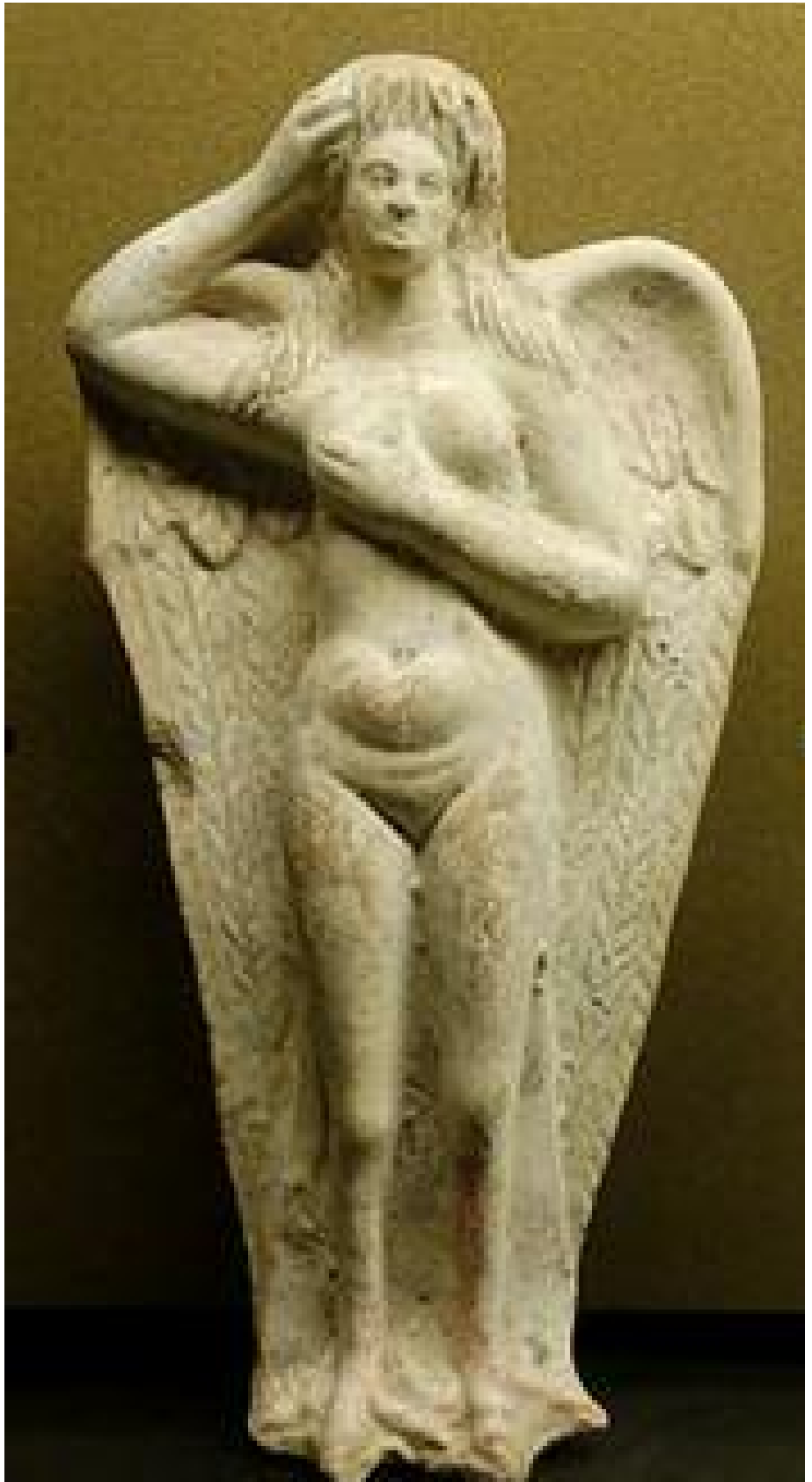
La Sirena di Myrina - I sec. a.C.