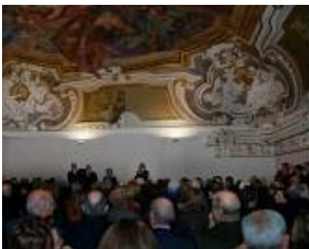
Particolare della sala delle feste a palazzo Mazzarino durante il concerto del 28-12-2011