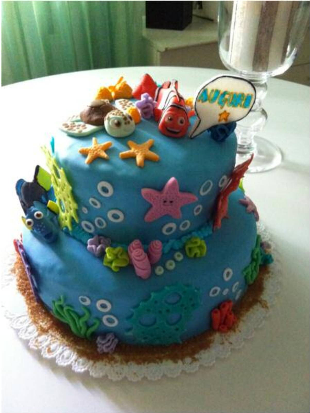
Torta Nemo, ispirata dalla lettura di Jules Verne