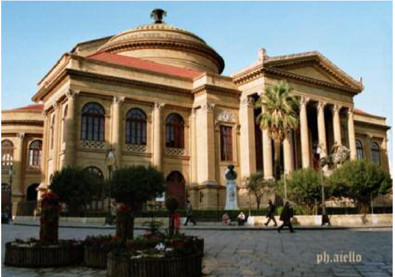
Veduta d'insieme del Teatro Massimo Vittorio Emanuele II

P assiamo adesso all'altro architetto palermitano: Giovan Battista Filippo Basile (1825-1891). Nato da modesta famiglia, fu avviato agli studi dal prof. Timeo, scienziato di fama internazionale e direttore dell'Orto Botanico di Palermo. Dopo aver conseguito la laurea in scienze fisiche e matematiche ottenne per concorso la laurea in architettura. Recatosi a Roma approfondì gli studi frequentando l'Accademia di S. Luca. I moti insurrezionali del 1848 lo riportarono a Palermo e nel decennio 1848-1859 si diede allo studio dei monumenti storici della Sicilia. Nel 1860 fu nominato professore ordinario di architettura all'Università di Palermo e gli venne conferita la Croce dell'Ordine Mauriziano. Nel 1864 partecipò al concorso indetto dal Comune di Palermo per la costruzione di un teatro, al quale parteciparono trentacinque concorrenti nazionali e stranieri (svizzeri, francesi, olandesi, inglesi). La giuria presieduta