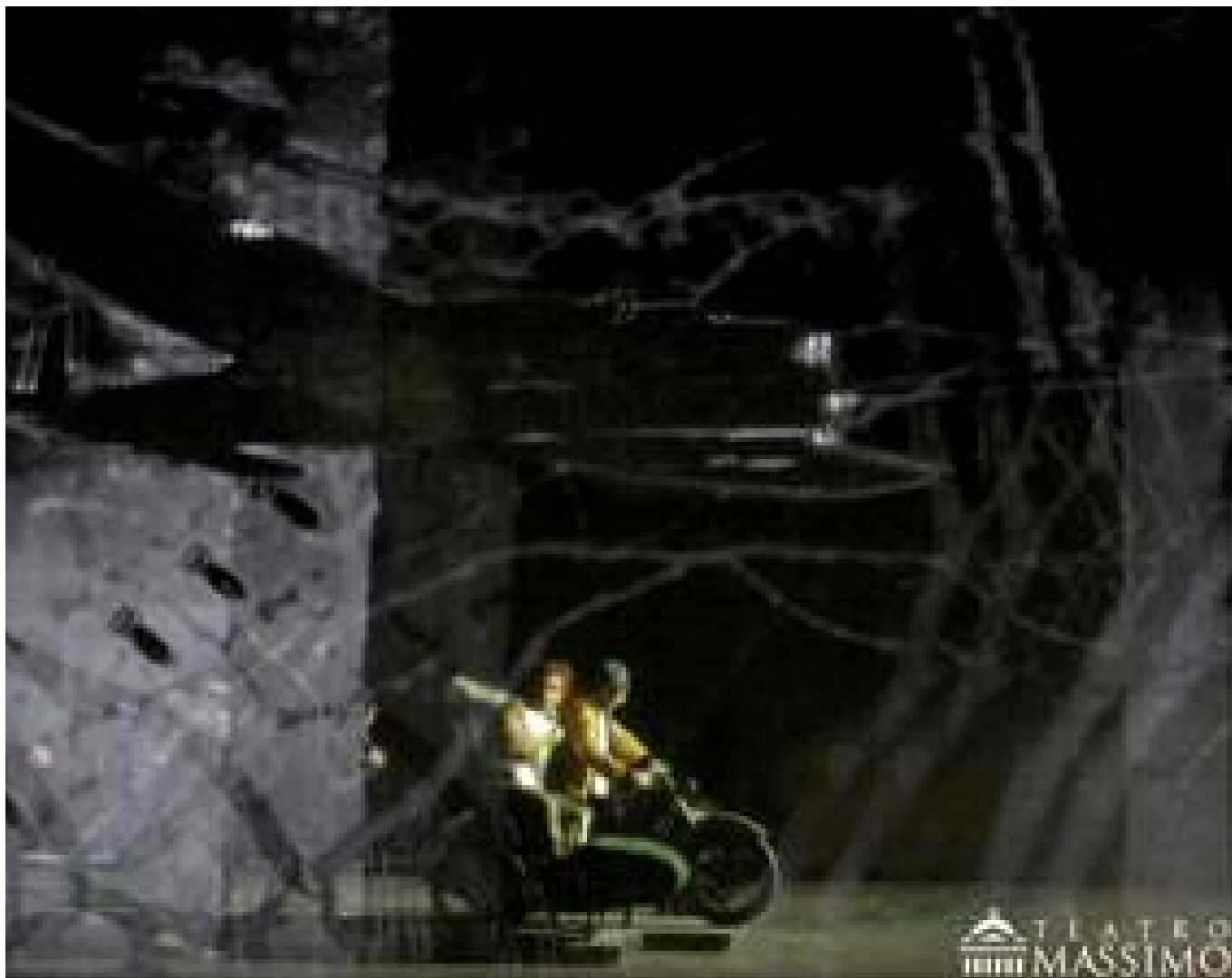
A Palermo - PhotoGallery Massimo

grandioso di rendere il “grandioso”, già insito nell’impianto orchestrale. Forse nella “meraviglia” mediatica di stampo barocco marinista, come di solito, è passata in secondo ordine la musica, diretta da un Abbado, Roberto, figlio di Marcello e nipote di Claudio. Perché in questa prova è stata la vera rivoluzione musicale che, dato un taglio alle creazioni ottocentesche a cominciare dalla grandiosa fortuna della sinfonia, oscillava tra la soluzione sonora di paesaggi e stati d’animo e imprecisate forme operistiche, nel preannunzio di Mahler. Probabilmente era il poema sinfonico che sollecitava il genio di Berlioz (del 1893 il Prélude à l’après-midi d’un faune di Debussy e Nuovo Mondo di Dvorak). Pertanto spesso sono eseguiti separatamente i tre pezzi orchestrali, la Marche Hongroise, una geniale versione della Marcia di Radoczi, che si sovrappone al canto dei contadini, la parodia della Fuga Amen, il portentoso Ballet des