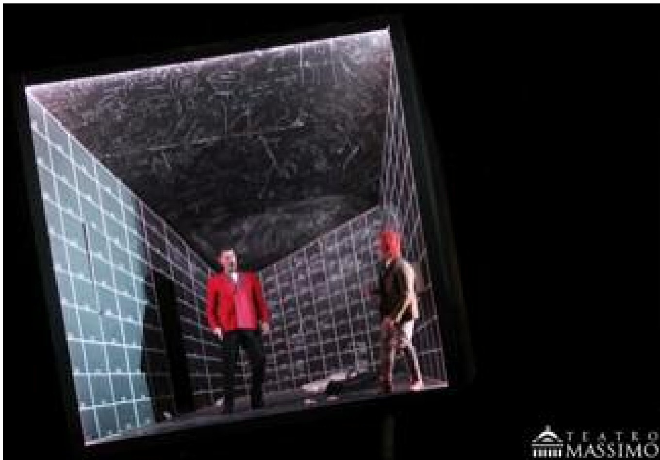
A Palermo

prodando nella fantascienza delle dodici scimmie e nella fantasia di I fratelli Grimm e l'incantevole strega.