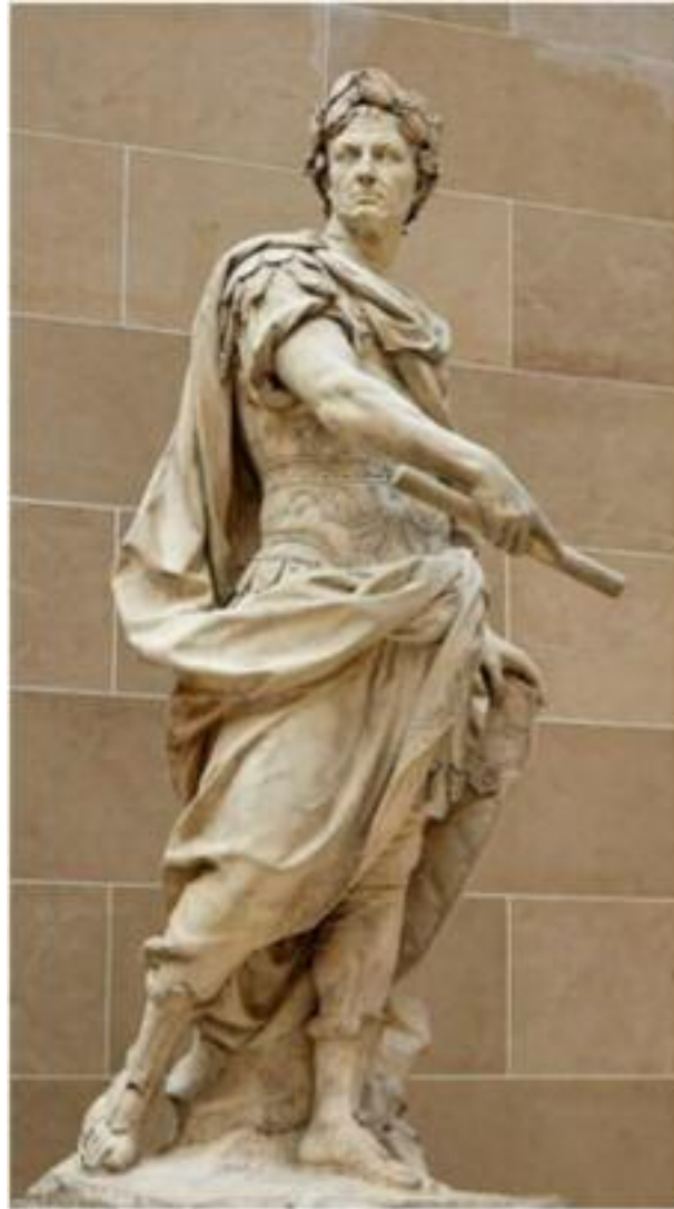
Statua di Cesare di Nicolas Coustou, 1696

N el Macbeth di Shakespeare (atto V, scena VIII), il protagonista dice di essere protetto da un incantesimo: “ Non può essermi tolta ( la vita) da nessuno nato di donna” . Gli risponde Macduff : “ Dispera del tuo incantesimo e l’angelo che hai servito fin qui ti dica come fu tratto con un taglio innanzi termine Macduff dal grembo di sua madre”. Queste parole esprimono l’opinione antica sulla nascita per parto cesareo, cioè non nato.