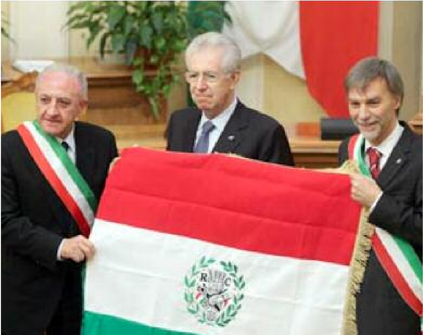
Il Presidente del Consiglio Mario Monti a Reggio Emilia

Oggi, 7 gennaio 2012 si festeggia il tricolore. L'articolo 12 della Costituzione Italiana prescrive: “la bandiera della Repubblica è il Tricolore italiano: verde, bianco e rosso, a tre bande verticali di eguali dimensioni”. La celebrazione è stata istituita dalla legge n. 671 del 31 dicembre 1996, e ricorda che il tricolore è nato a Reggio Emilia il 7 gennaio 1797. Oggi il Presidente del Consiglio Mario Monti ha partecipato a Reggio Emilia alla celebrazione e nel suo ampio discorso ha toccato il tema dell'attuale crisi economica dicendo parole incoraggianti: “Se guardiamo dentro noi