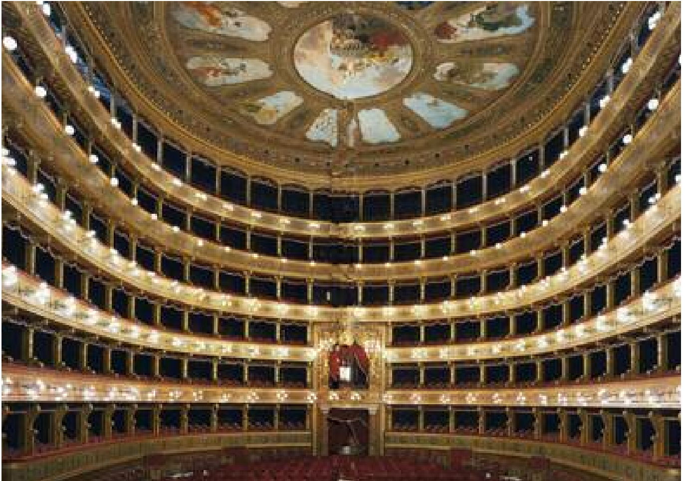
Veduta dell'interno verso il Palco Reale

in asse rispetto alla via Maqueda, realizzato da Giuseppe Damiani Almeyda, all'inizio di Via Libertà. Il Teatro Massimo ricopre una superficie di 7730 metri quadrati e vi si accede tramite una grandiosa scalinata che termina con un colonnato corinzio esastilo. Ai lati della scalinata, due sculture bronzee: "La Tragedia" (opera di Benedetto Civiletti) e "La Lirica" (di Mario Rutelli).