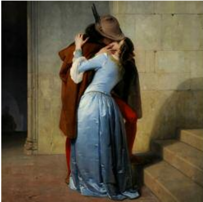
Francesco Hayez 1859

O rmoni o amore? Comportamento istintivo o appreso? Nessuno ancora lo sa, ma sta di fatto che il bacio è un gesto umano molto antico. Le sue prime testimonianze risalgono ai testi vedici indiani, probabilmente del 1.500 a. C.; testimonianze indirette ci riportano ai Sumeri ed all'uso del rossetto. Il termine tecnico è osculazione (dal latino osculum-i, bacio, diminutivo di os-oris, da cui il verbo osculari ed il sostantivo osculatio-onis). Il nostro bacio, deriva dal sostantivo basium-i, da cui il verbo basiare, di probabile origine celtica, termine usato da Catullo. Ma non si baciano soltanto gli umani, si baciano anche le scimmie antropomorfe e per parecchi minuti di seguito. Gli studiosi sono comunque d'accordo almeno su una cosa che il bacio determina una reazione biologica: i vasi sanguigni si dilatano, il polso è più veloce, le pupille si dilatano, mentre vengono rilasciati ormoni e neurotrasmettitori che danno sensazioni di piacere che sviluppano attaccamento.