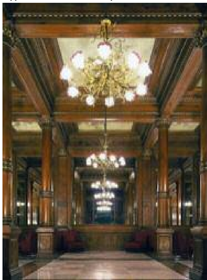
Teatro Massimo, salotto del palco reale.

Ma veniamo all'opera maggiore del Basile, il Teatro Massimo, che gli diede gloria e lo collocò tra i migliori architetti dell'Ottocento. Il Teatro Massimo, intitolato al re Vittorio Emanuele II, è il secondo dopo l'Opéra di Parigi (terzo secondo alcuni studiosi), nasce in un momento di rigoglio economico e culturale quando Palermo intesseva rapporti con il resto dell'Europa.