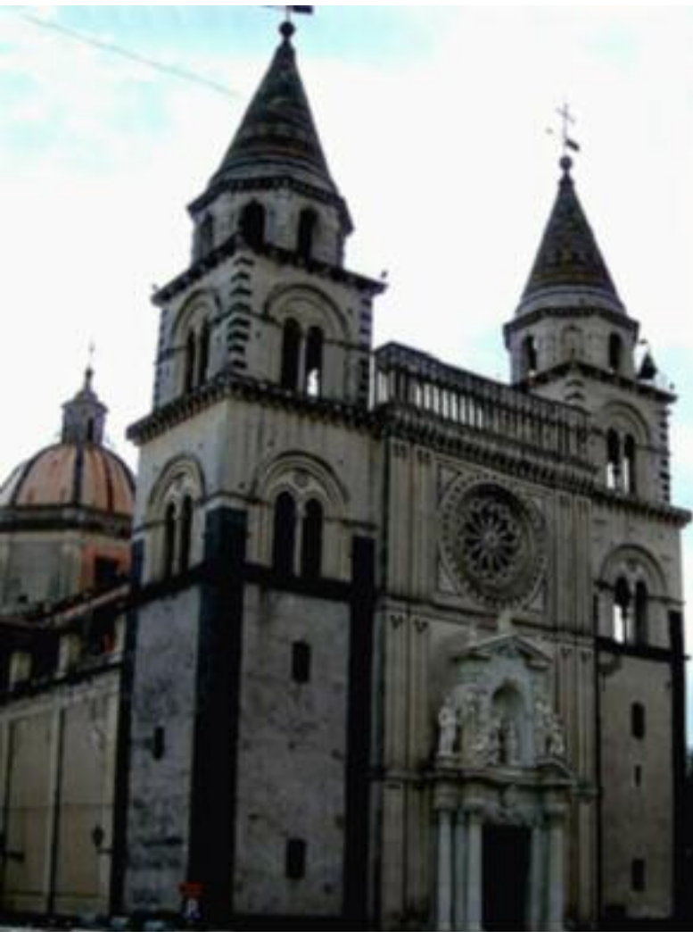
La facciata del Duomo di Acireale.

giardini come la Villa Garibaldi e il Giardino Inglese, sempre a Palermo, Piazza Marina e la Villa Vittorio Emanuele a Caltagirone, la facciata del padiglione italiano all'Esposizione Universale di Parigi e per questo lavoro ebbe dalla Francia la Croce di Ufficiale della Legione d'Onore e dall'Italia la Commenda di San Maurizio e della Corona d'Italia. Tra le opere più significative va ricordato il rifacimento della facciata in stile gotico del Duomo di Acireale.